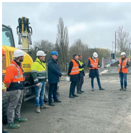
Großer Bahnhof bei der Pflanzaktion (l). Die per Kran eingeschwebten Bäume werden mit Seilen verankert (r).