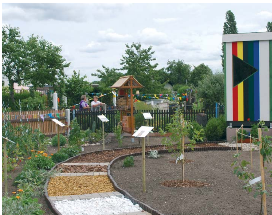
Der Ideengarten wurde beim 20. „Tag des Gartens“ eingeweiht.

Der Verein überstand die weiteren politischen und gesellschaftlichen Entwicklungen gut und konnte 1986 sein 100-jähriges Bestehen feiern. 1990 reagierte der Verein auf die veränderten Bedingungen und wurde unter dem Namen „Verein für naturgemäße Gesundheitspflege“ e.V. im Vereinsregister eingetragen. Das war ei-