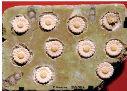
Eine altägyptische Fayence-Wandfliese mit eingelegten Gänseblümchenblüten aus der Zeit um 1.400 v. Chr.

Das Gänseblümchen ist eine interessante Nahrungspflanze und wichtige Zutat für Wildsalate und Frühjahrsuppen. Die jungen Blätter, Knospen und Blüten bereichern Gemüse- und Spinatgerichte und können unter Kräuterquark und -käse gemischt werden. Außerdem können die Blüten für Tee und die gesamte Pflanze zur Gewinnung von Frischsaft genutzt werden. Junge, noch nicht so stark behaarte Blütenknospen sind eine delikate Beigabe in Wildsalaten. Ältere Knospen