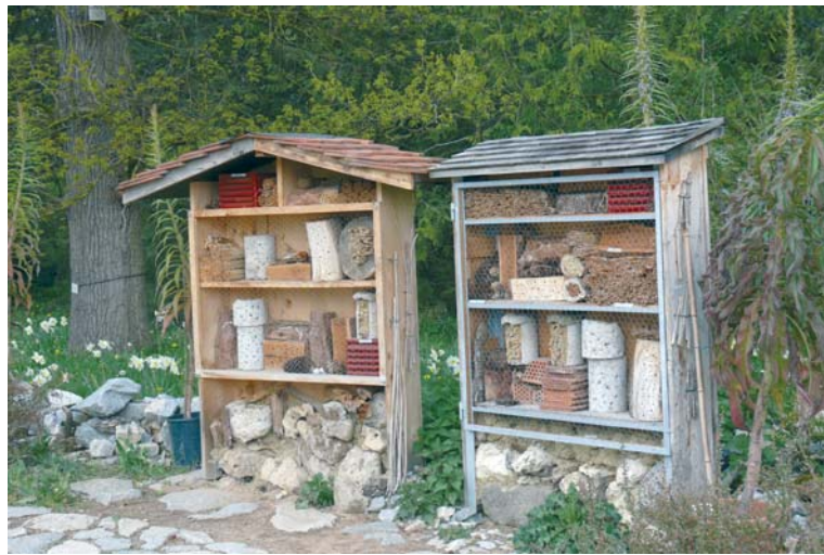
Insektenhotels (hier zwei Exemplare im Botanischen Garten München) lassen sich mit einfachen Mitteln bauen.

Insektenhotels sind Nist- und Überwinterungshilfen für die Nützlinge im Garten. Eltern oder Großeltern können so ein Hotel mit Kindern oder Enkeln selbst bauen. Das ist leicht, mein Mann hat mit den Enkelkindern eines gebaut, dazu wurden vier Hül- sen, vier Pfosten, Bretter, Baumstüm-