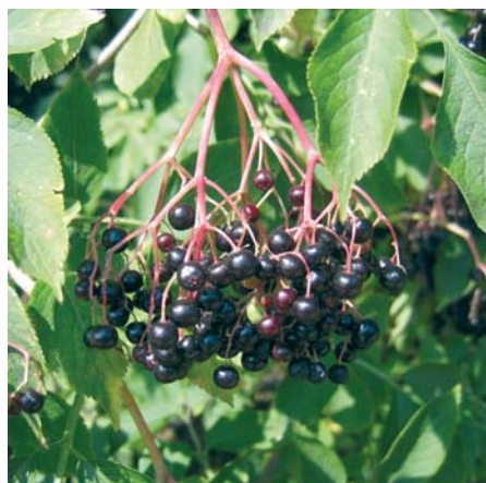
Die Holunderbeeren können u.a. zu Konfitüre verarbeitet werden.

lingen recht gut. Besondere Pflegemaßnahmen sind nicht erforderlich. Aller zwei bis drei Jahre sollte durch