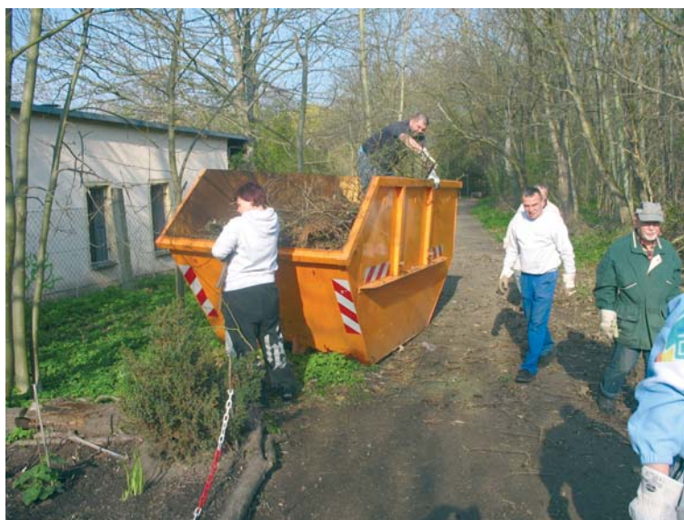
Die Leipziger Kleingärtner sind seit vielen Jahren beim Frühjahrsputz rund um ihre Anlagen im Einsatz.

Wanderheft: Das Heft wird am Start ausgegeben, es enthält die Strecken-