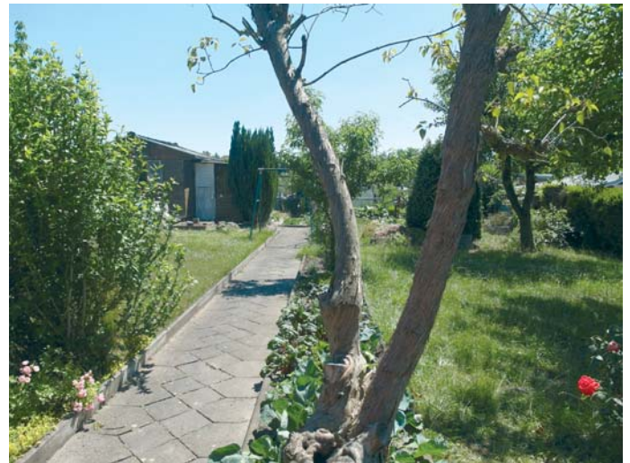
In dieser Parzelle ist die kleingärtnerische Nutzung schon auf den ersten Blick deutlich erkennbar ist.