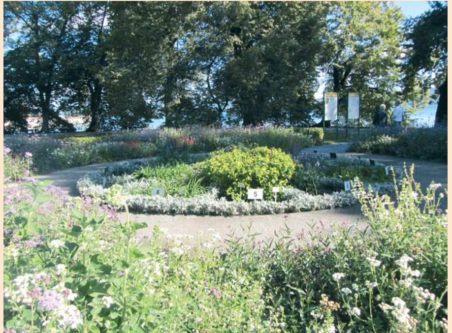
Die Blumenuhr auf der Insel Mainau, im Hintergrund sind die Infotafeln.

Lenny beobachtet weiter: Es wimmelt von Bienen, Hummeln