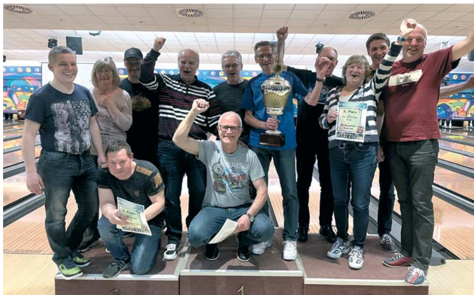
Das waren die Siegerteams: Am Finkenweg (Mitte), Pinschubser Freiland (links) und Seilbahn 1 (rechts).

Ein Wechsel hat auch am Tabellenende stattgefunden: Der Trostpreis für die wenigsten Pins ging in diesem Jahr an das Team „Sonnenblume 1“