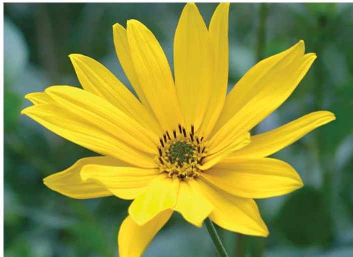
Schön, aber potenziell invasiv, wenn man ihn nicht im Zaum hält: Topinambur.

Die Stängel werden bis zu drei Meter hoch und bilden bei ungestörtem Wachstum einen saisonalen Sichtschutz. Die mehrjährige Pflanze, die in der