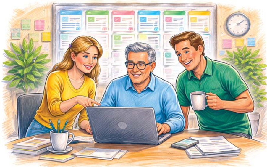
Ein Ticketsystem kann die ehrenamtliche Arbeit im Verein erleichtern und den benötigten Zeitaufwand senken.

Vielleicht lohnt sich genau hier ein Perspektivwechsel, denn die Frage ist längst nicht mehr nur, wie Sie Ihren aktuellen Alltag entlasten, sondern auch, wie zukunftsfähig Ihr Ehrenamt aufgestellt ist. Wer heute Verantwort-