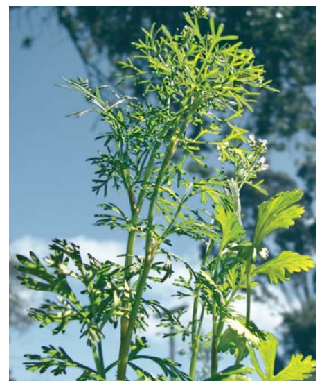
Koriander ähnelt der Blattpetersilie.