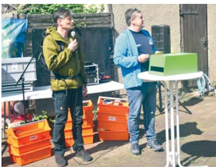
Bürgermeister Heiko Rosenthal würdigt die Initiativen der beteiligten Vereine.

Besten Dank an alle, die dazu beigetragen haben, auch die 21. Wanderung so erfolgreich zu gestalten. -r