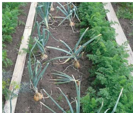
Karotten und Zwiebeln in traurem Miteinander.