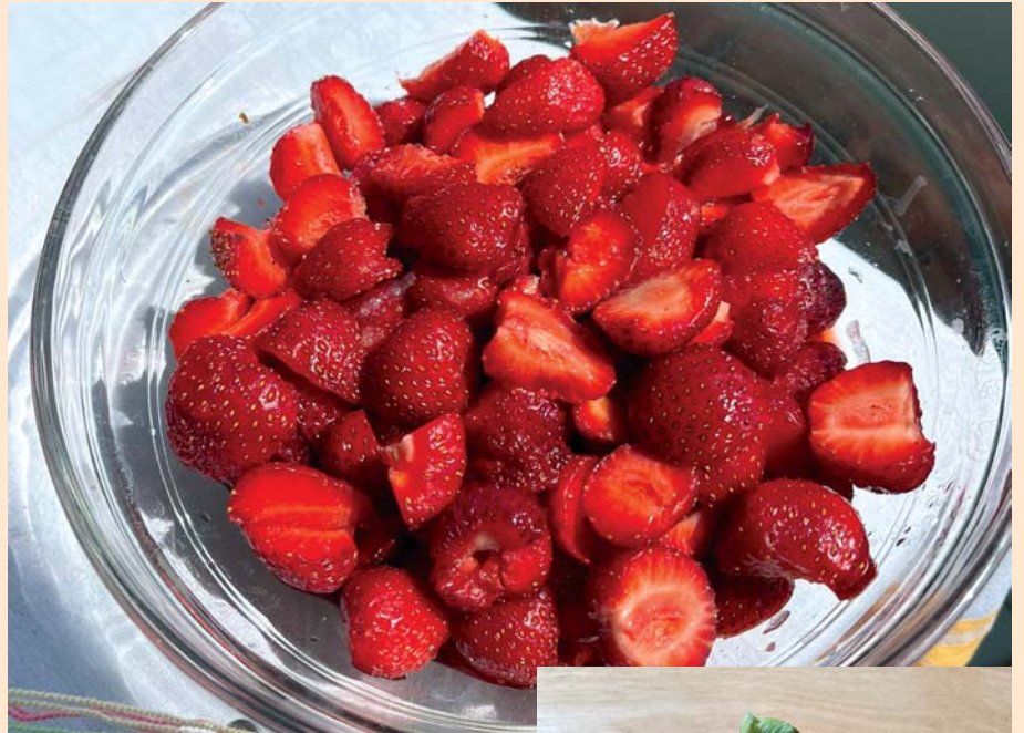
Lenny genießt seine Erdbeeren. Und alles begann mit dem kleinen Päckchen Frigo-Pflanzen (Bild rechts).

Was sind Frigo-Erdbeerpflanzen? Der Begriff „Frigo“ stammt aus dem Französischen und bedeutet „kalt“ oder „Kühlschrank“. Das weist schon auf das besondere Verfahren hin. Frigopflanzen sind keine eigene Art oder Sorte. Sie sind nur speziell behandelt. Es