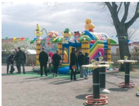
Spiel und Spaß gehören im KGV „Volksgarten“ schon immer zum Vereinsleben.