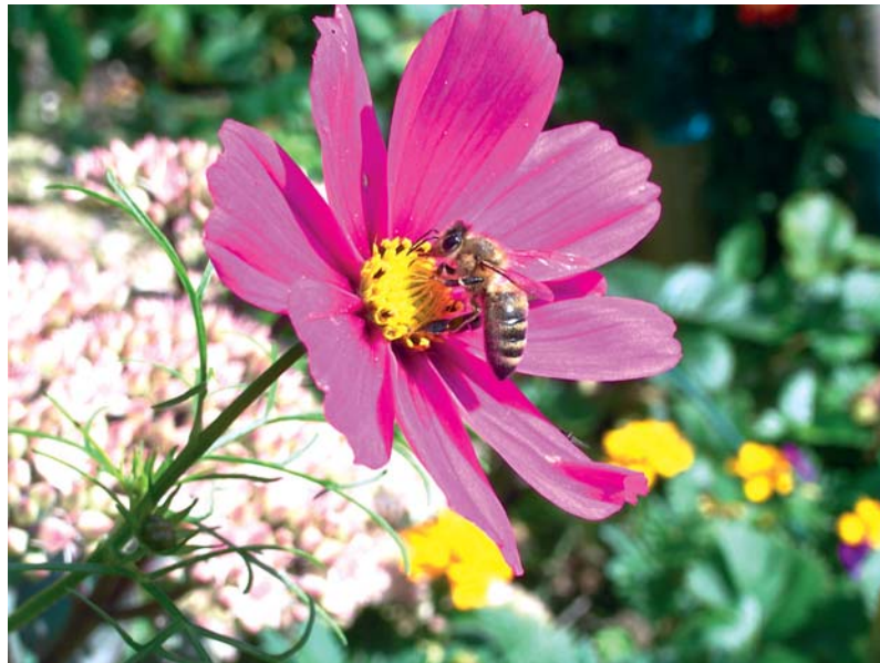
Unsere Autorin lässt die letzten Cosmea-Blüten Samen bilden. So säen sich die Pflanzen selbst fürs Folgejahr aus.

In der zweiten Junihälfte beginnt man, abgeerntete Beete mit im Mai ausgesät Grünkohl zu bepflanzen. Für einen Zweipersonenhaushalt reichen fünf Pflanzen, der Abstand sollte 40 bis 50 cm betragen. Ich ernte den Kohl bis März. Er ist nicht so frostempfindlich wie der Palmkohl und reich an Vitaminen C und K, Mineralstoffen, wie Eisen und Kalzium, und enthält Antioxidantien, die Entzündungen im Körper hemmen können.