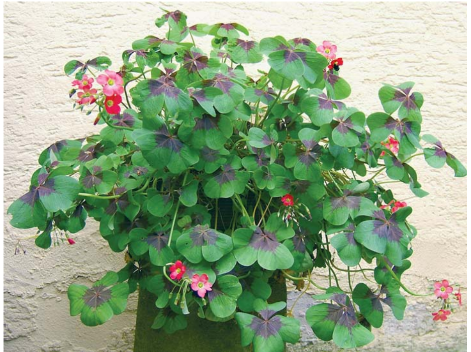
Eigentlich ist der Name Glücksklee widersinnig, denn bei dieser Art braucht man kein Glück, um ein vierblättriges Blatt zu finden.

Meistens zu Silvester wird dieser Klee in kleinen Töpfen mit Schweinchen, Hufeisen und Schornsteinfegern verkauft. Als Zimmerpflanze eignet sich dieser Glücksklee nur für kurze Zeit, da er sehr viel Licht benötigt und keine trockene Zimmerluft ver-