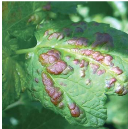
Das Schadbild der Johannisbeerblasenlaus.

Befall: Die Eiablage der Johannisbeerblasenlaus erfolgt im Herbst an die Johannisbeertriebe. Die im Frühjahr schlüpfenden Jungläuse saugen auf der Blattunterseite. Das führt zu dem beschriebenen Schaden. Die wirtswechselnde Blattlaus verlässt ab Juni die Johannisbeere und geht auf Wildpflanzen über. Im Herbst kehrt die Blasenlaus auf die Johannisbeere zurück, um ihre Wintereier abzulegen.