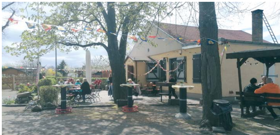
Das Vereinshaus im „Volksgarten“ ist ein beliebter Treffpunkt.