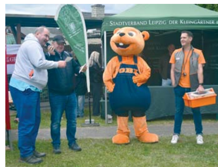
OBI-Rätselspaß: Die Verlosung ist stets ein Höhepunkt (Archivbild 2025).