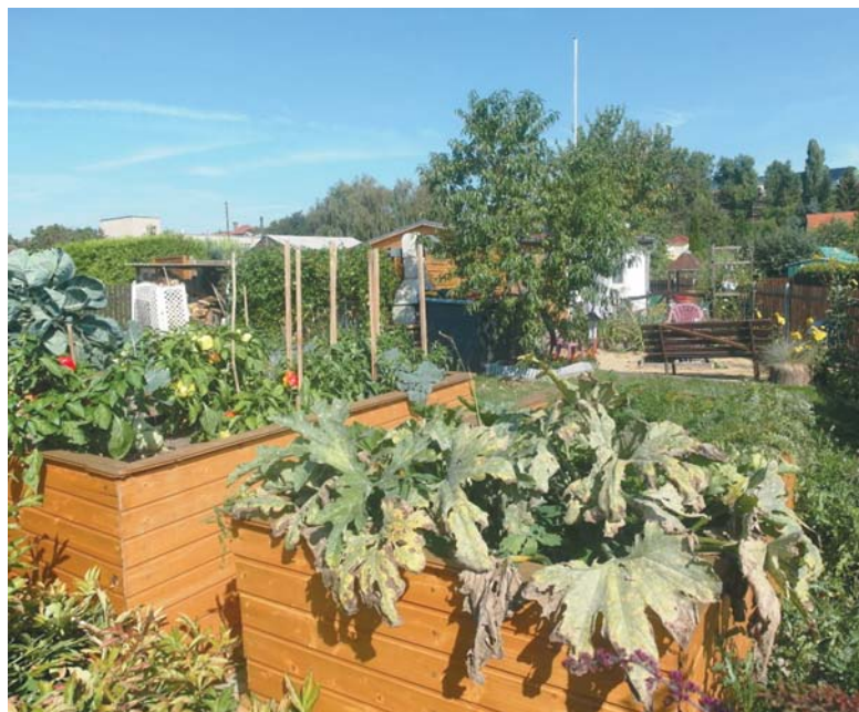
Rückenfreundliche Hochbeete sind für senioren-gerechte Gemeinschaftsgärten geeignet.

Damit ist die Klärung des Problems eigentlich nur verschoben. Irgendwann wird der Pächter das Pachtverhältnis aufgeben. Sowohl der über Jahrzehnte genutzte Garten als auch die über lange Zeit gewachsene Gemeinschaft sind jedoch gerade für ältere Kleingärtner wichtig. Die Kleingärtnergemeinschaft ist oft intensiver als die im Wohnumfeld. Eine Alternative – vor allen in größeren Anlagen – wäre ein Gemeinschaftsgarten, der kleingärtnerisch genutzt wird. Damit besteht die Möglichkeit, weiter gärtnern zu können, auch wenn die Kraft nicht mehr ausreicht, um die eigene Parzelle zu bewirtschaften.