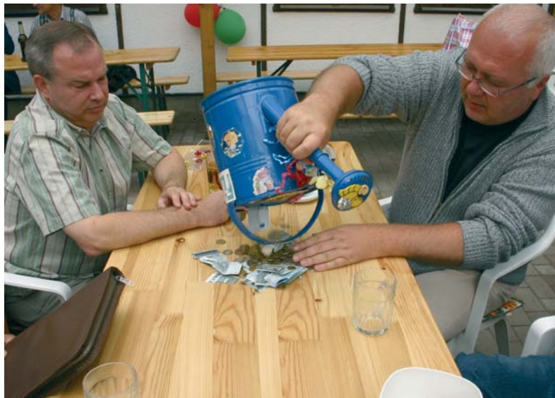
Gemeinschaftsarbeit für ältere Gartenfreunde.

Es sollte jedoch bedacht werden, ob es richtig ist, ältere Vereinsmitglieder durch Beschluss der Mitgliederversammlung von so einem wichtigen Teil des Vereinslebens auszuschließen. Manche Gartenfreundinnen und Gartenfreunde könnten sich ausgestoßen fühlen, wenn sie nicht mehr dazu herangezogen würden. Besser ist es, die Gemeinschaftsarbeit so zu organisieren, dass auch ältere Gartenfreunde die Möglichkeit haben, entsprechend ihrer körperlichen Verfassung bestimmte Aufgaben zu erfüllen.