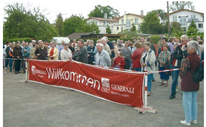
Der Start zur 21. Wanderung am 9. Mai 2026.