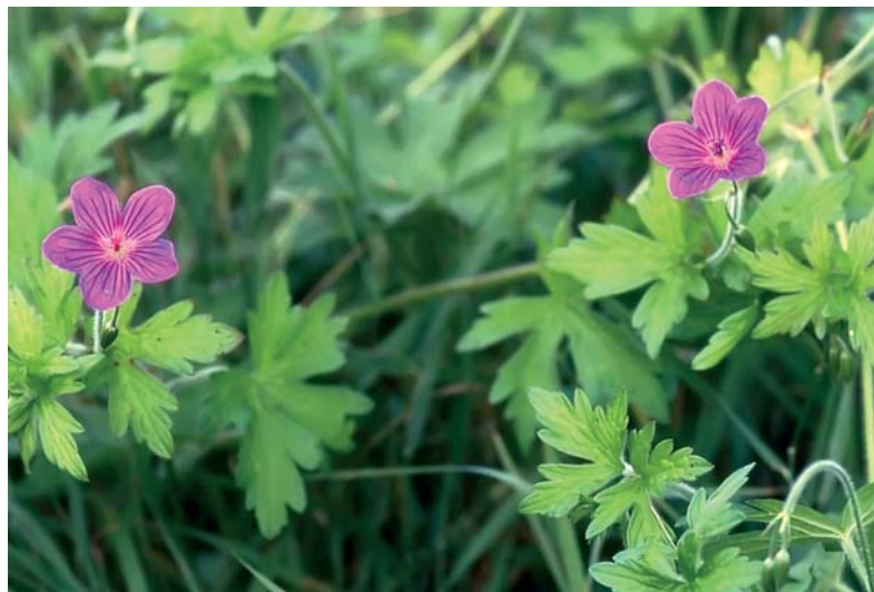
Der Sumpfstorchschnabel gehört zu den Geranien.