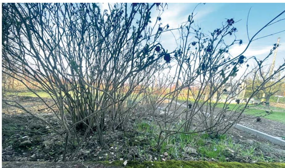
Durch die langen Seitenwurzeln macht sich die Kartoffelrose breit.

Die Kartoffelrose wird ca. 120 bis 150 cm hoch. Ein deutliches Unterscheidungsmerkmal zu anderen, heimischen Wildrosen ist der behaarte Trieb, der schon an Filz erinnert. Keine andere Wildrose bei uns hat so viele kleine Dornen. Sie wächst zwar jährlich nur 20 bis 40 cm in die Höhe, bildet aber gleichzeitig sehr lange Seitenwurzeln. Wird dieses Seitenwachstum der Ausläufer nicht unterbunden,