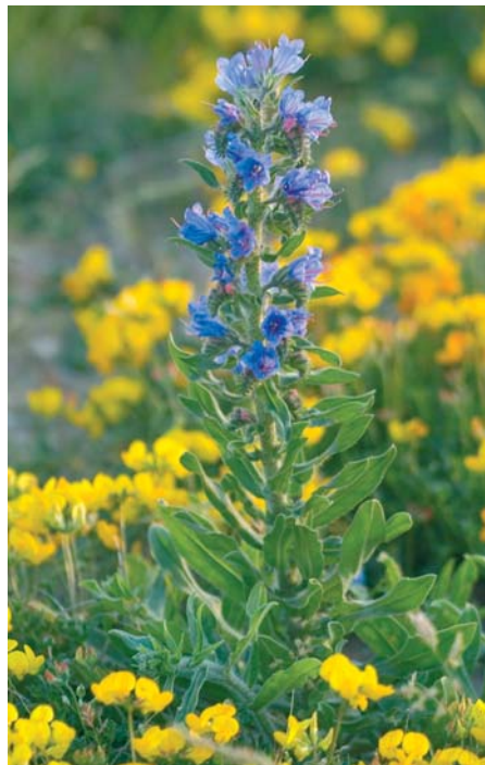
Sieht gut aus und tut der Natur gut: der Gewöhnliche Natternkopf.