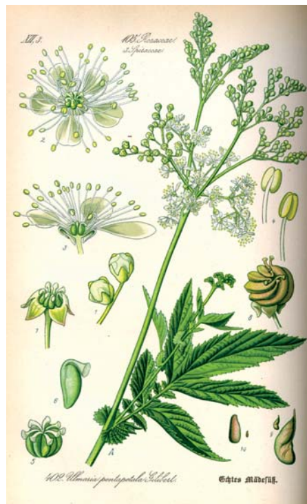
Abb. aus „Flora von Deutschland, Österreich und der Schweiz“ (1885), Otto Wilhelm Thomé / gemeinfrei

Die Pflanze bietet vielfältige Verwendungsmöglichkeiten. Aus ihren Blüten lässt sich ein Tee zubereiten. Der Stängel und der Wurzelstock gelten als essbar und können Salaten zugesetzt werden. Durch das starke Aroma können alle Pflanzenteile für verschiedene Lebensmittel genutzt werden. Aufgrund der Aromastoffe wird es auch als Streukraut verwendet, um Zimmer zu aromatisieren.