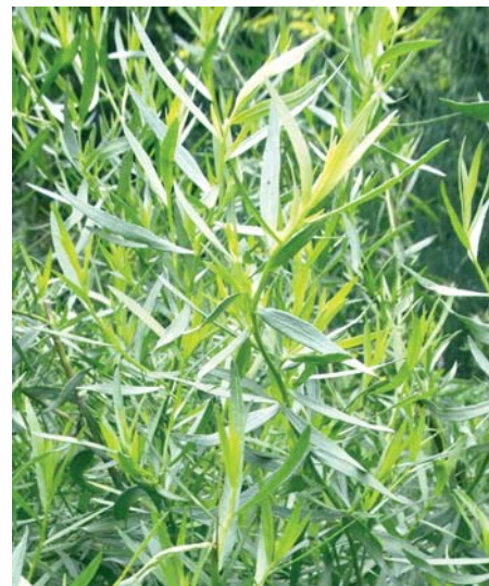
Deutscher bzw. Französischer Estragon.

Standort. Der Boden sollte nährstoffreich, feucht, aber nicht ständig nass sein. Der Französische Estragon kann nur durch Kopfstecklinge oder Wurzel ausläufer vermehrt werden. Der Russische Estragon kann auch durch Samen vermehrt werden. Die Aussaat erfolgt im April direkt ins Freiland. Der