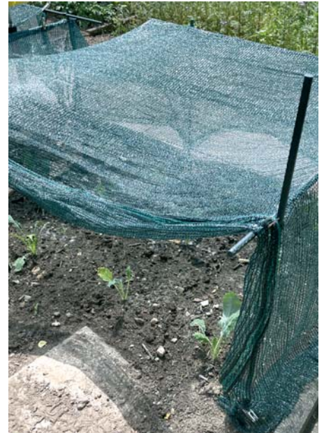
Die aus Pflanzstäben zusammengesteckte Konstruktion (l.) trägt Sichtschutznetze (r.). So lassen sich Kulturen leicht vor zu viel Sonne schützen.