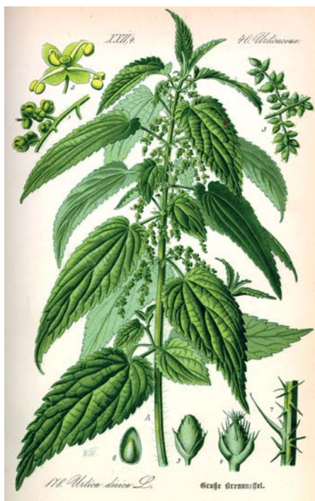
Abb. aus „Flora von Deutschland, Österreich und der Schweiz“ (1885), Otto Wilhelm Thomé / gemeinfrei

Die Brennnessel wirkt mild diuretisch und unterstützt Blase und Harnwege bei Reizblase und leichten Infekten. Die Brennnessel hilft bei Leber- und Nierenleiden und sollte fester Bestandteil von Frühjahrskuren sein. Die Kieselsäure ist förderlich für Haut, Haare und Bindegewebe. Die Vitamine stärken das Immunsystem und bieten Zellschutz. Die Mineralstoffe, vor allem Eisen, Magnesium, Kalium und Calcium, sind positiv für die Blutbildung und Eisenversorgung.