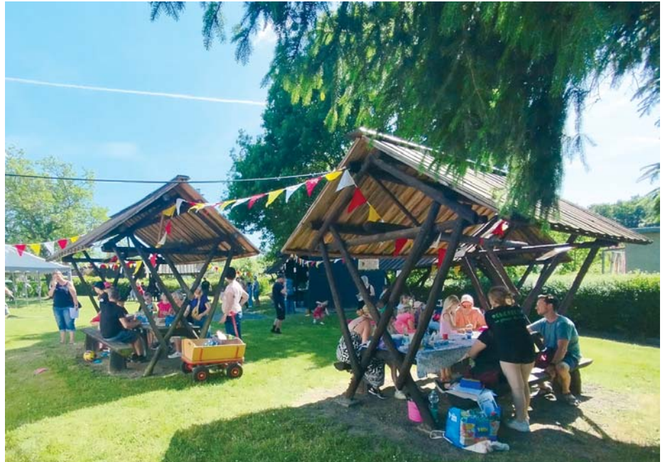
Die geschmückte Festwiese in der Vereinsanlage.