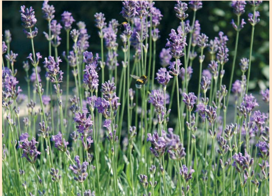
Lennys Kopfgummeln ist verschwunden. Wahrscheinlich hat der Duft des Lavendels (und einiger anderer Kräuter) ihm geholfen.

Wie soll Lenny da das richtige Kräutlein für sich und sein Kopfgummeln finden? Aber das ist