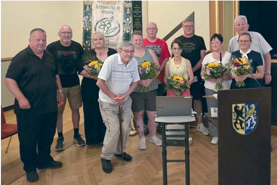
Der alte und zugleich neue Vorstand des Kreisverbandes.