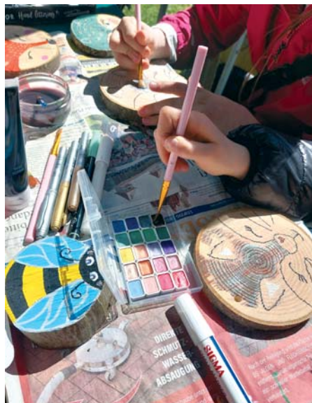
Auch Basteln mit Kindern gehört zur Öffentlichkeitsarbeit.