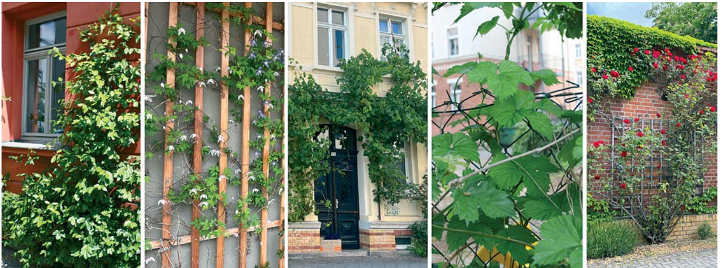
Kletterpflanzen auch für Kleingärten: Kriechspindel, Alpenwaldrebe, Weinrebe, Hopfen, Kletterrose (v.l.n.r.).