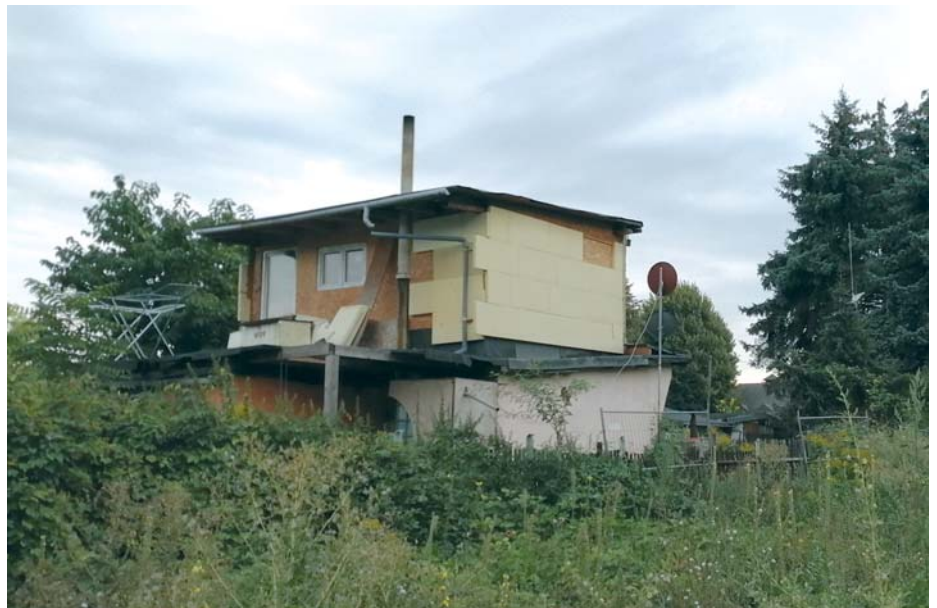
Bestandsschutz lag in diesem (älteren) Fall sicher nicht vor.

Die damit verbundene Arbeit lohnte sich. Es gab frisches Obst und Gemüse aus dem eigenen Garten, das auch zum Beschaffen anderer Produkte hilfreich war. Mit den Jahren wurde das Obst- und Gemüseangebot im Handel besser. Immer mehr Kleingärtner nutzten das und gestalteten ihren Garten um. Der Erholungscharakter des Kleingartenwesens nahm deutlich zu. Wegen der damaligen politischen und gesellschaftlichen Verhältnisse vollzog sich diese Entwicklung in den sogenannten alten Bundesländern der BRD schneller als im Gebiet der ehemaligen DDR. Um die Existenz des Kleingartenwesens mit seinem sozialen Charakter zu sichern, wurde in der damaligen BRD 1983 das Bundeskleingartengesetz (BKleingG) beschlossen. Seit Oktober 1990 ist es auch im Gebiet der ehemaligen DDR verbindlich. Es ist ein Sonderrecht und fasst das bundeseinheitlich geregelte Kleingartenrecht in einem Ge-