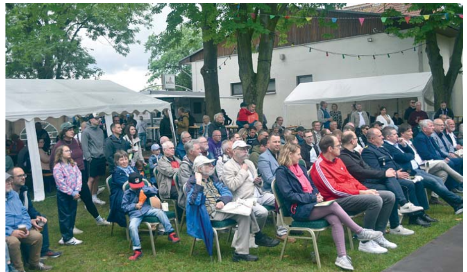
Etwa 200 Teilnehmer besuchten die Festveranstaltung zum 35. Tag des Gartens.