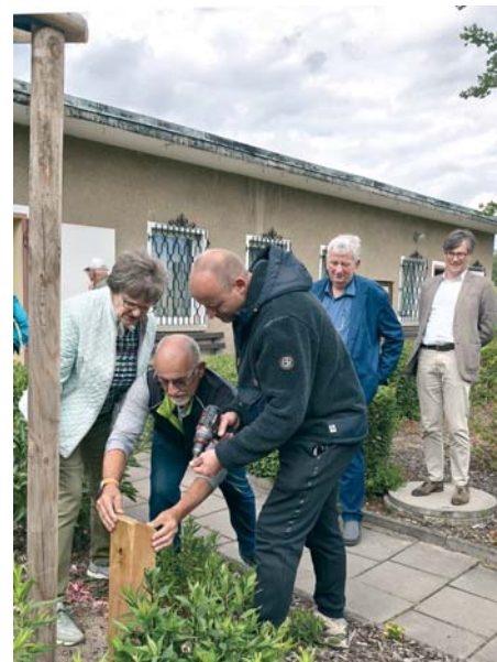
Mit dem Anbringen der Messingplakette ist die Pflanzung komplett.

Wir wünschen Frau Ahlert für die Zukunft alles Gute und viel Gesundheit. -kvl