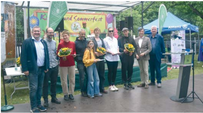
Die Preisträger des Wettbewerbs „Naturnaher Kleingarten“.