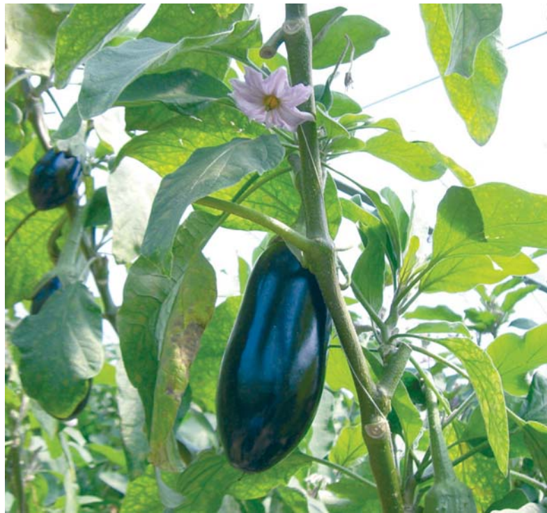
Erscheinen an der Aubergine die Blüten, sollte der obere Teil des Haupttriebes gekappt werden.

Der im Mai/Juni gepflanzte Porree verlangt im Juli viele Nährstoffe, Wasser und laufende Hackarbeit. Damit sich der tiefgepflanzte Porree gut entwickeln kann, ist der Boden ständig zu