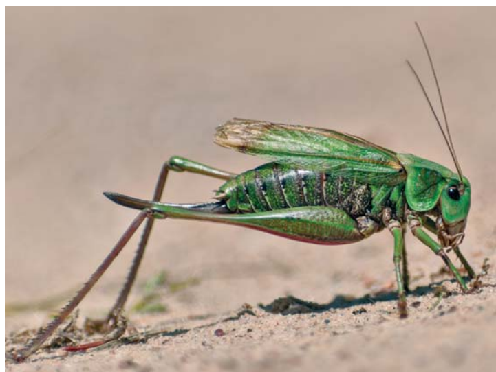
Der Warzenbeißer (hier ein weibliches Exemplar mit Legerohr) ist eine imposante Erscheinung.

Der Name ist für eine Heuschrecke sehr ungewöhnlich; er stammt aus einem Volksglauben. Früher dachte man, die Heuschrecken können War-